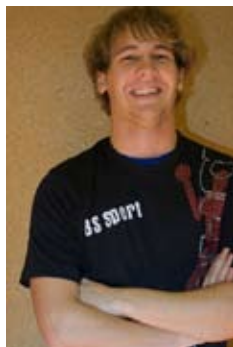
Nr. 4 RA/ RR