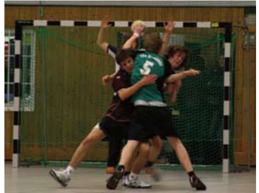
Die Abwehr in Aktion unten: Die Mannschaft

Um lautstarke Unterstützung wird gebeten um 15:00 Uhr in der Birrenkovenallee.