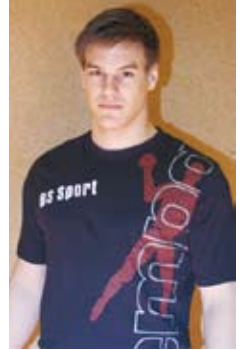
Nr. 3 LA/ KM