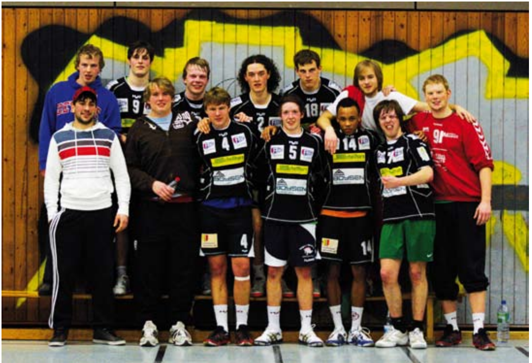
Die männliche A-Jugend